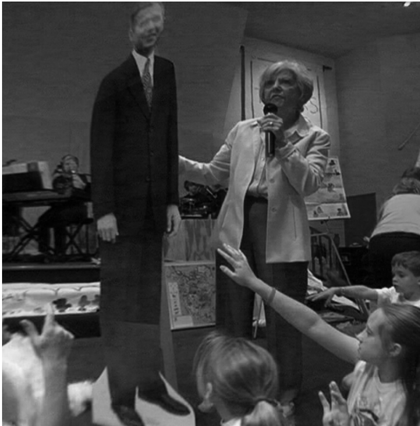
Scène uit Jesus Camp: Kinderen aanbidden een kartonnen bord met de afbeelding van George W. Bush